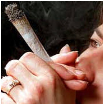
DPA Joint-Raucherin: Viele Studenten sind mindestens Gelegenheitskiffer

Die Bundesbildungsministerin warnt: Ein Studium gefährdet die Gesundheit - mindestens das seelische Gleichgewicht. Das legt eine noch unveröffentlichte Studie der Katholischen Fachhochschule Nordrhein-Westfalen nahe, die gerade im Auftrag des Bildungsministeriums Drogenkonsum und suchtnahe Verhaltensweisen bei Studierenden untersucht.