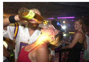
US-Studenten: Berüchtigt für ihre Trinkspiele

An Essstörungen leiden allerdings neun Prozent der Studentinnen - doppelt so viele wie im Bevölkerungsdurchschnitt. Zudem sind viele Studenten Gelegenheitskiffer: 28 Prozent beschränken den Konsum auf weniger als 16 Mal pro Jahr, immerhin acht Prozent rauchen allerdings mehr als 40 Mal jährlich Cannabis.